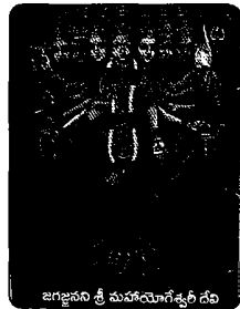
జగజ్జనని శ్రీ మహాయోగేశ్వరీ దేవి