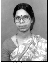
భాగవతుల శారద తృతీయ బహుమతి

2010 వసంత పంచమి సందర్భంగా : వక్తృత్వ పోటీలు