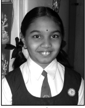
పి|| అమూల్య ప్రథమ బహుమతి

2010 వసంత పంచమి సందర్భంగా : వక్తృత్వ పోటీలు